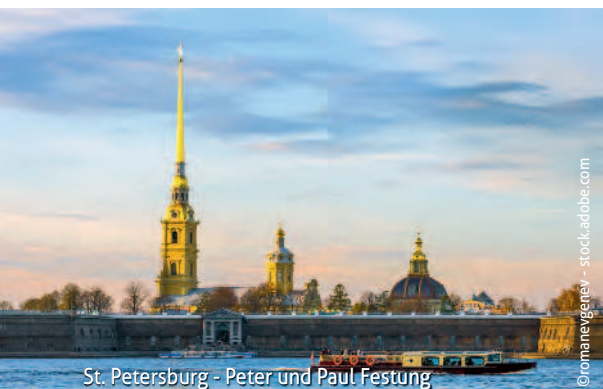
St. Petersburg - Peter und Paul Festung