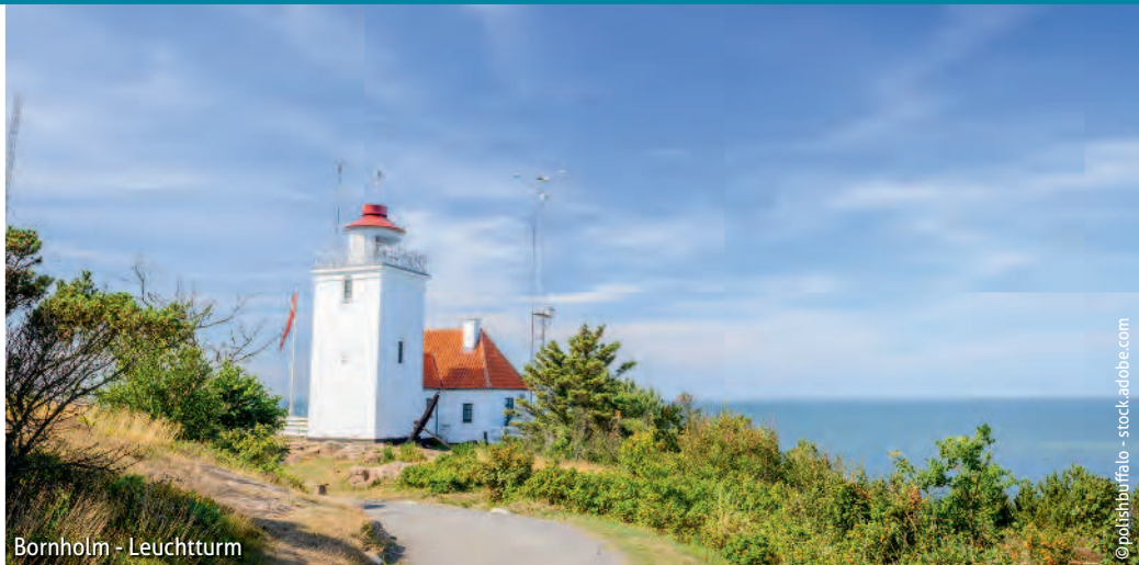
Bornholm - Leuchtturm

➤ Ankunft: 08:00 Uhr ➤ Abfahrt: 17:00 Uhr