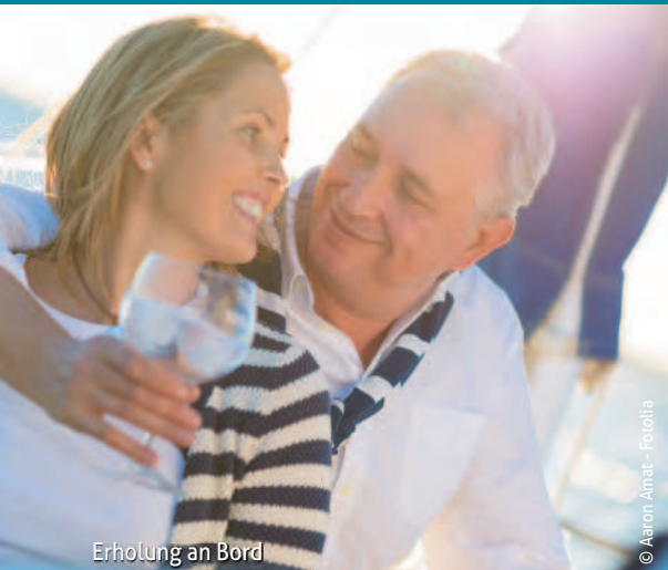
Erholung an Bord