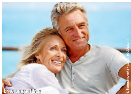
Erholung auf See