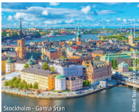
Stockholm - Gamla Stan