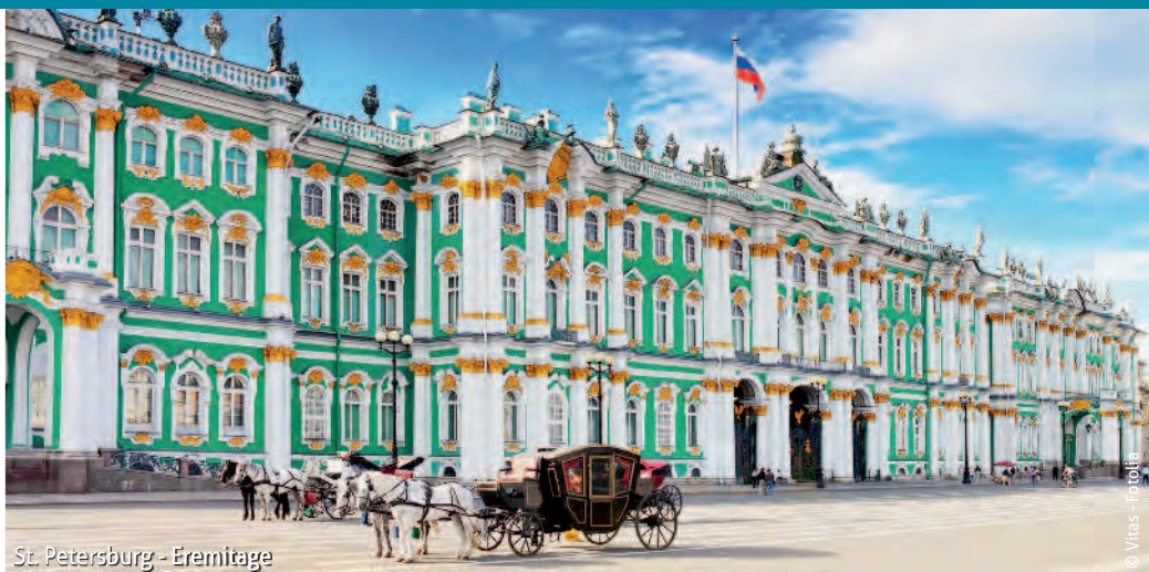
St. Petersburg - Eremitage