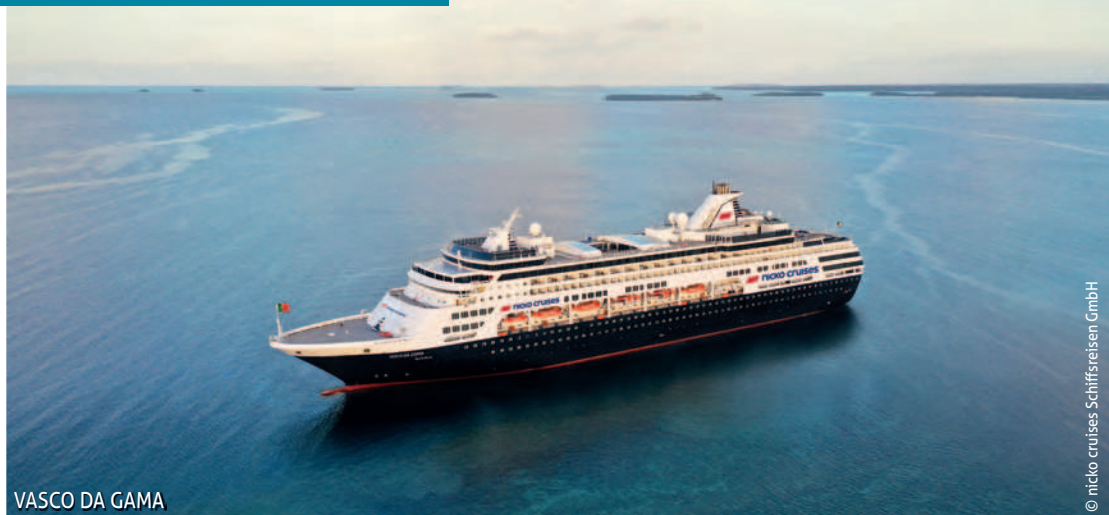
VASCO DA GAMA