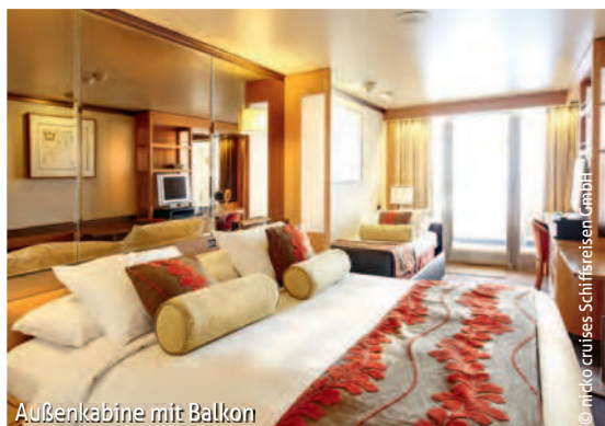
Außenkabine mit Balkon