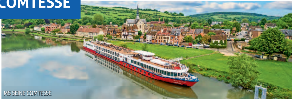
MS SEINE COMTESSE