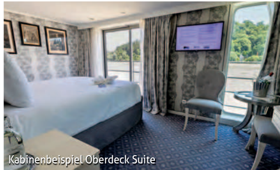
Kabinenbeispiel Oberdeck Suite