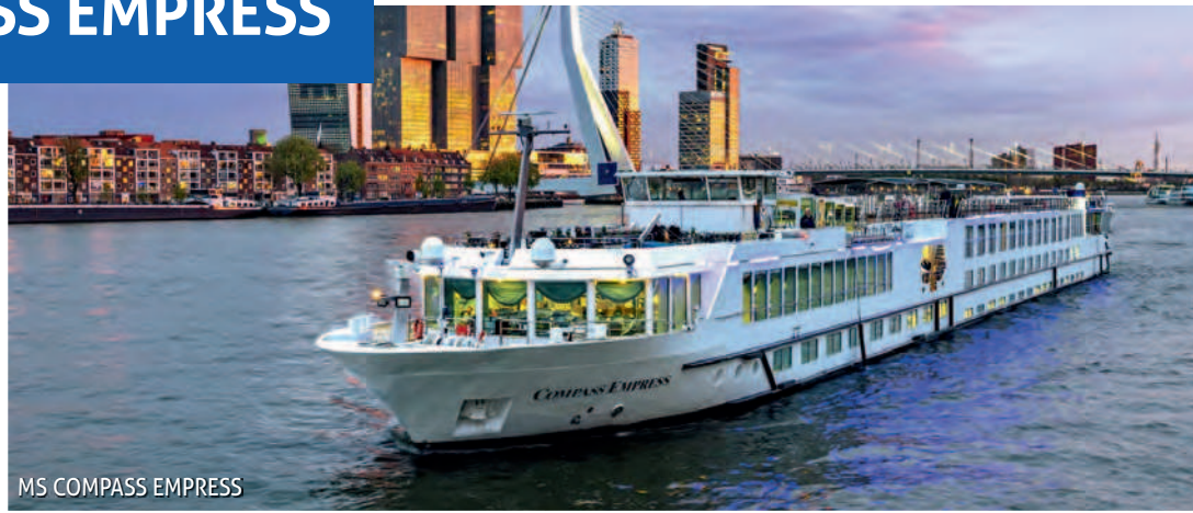
MS COMPASS EMPRESS