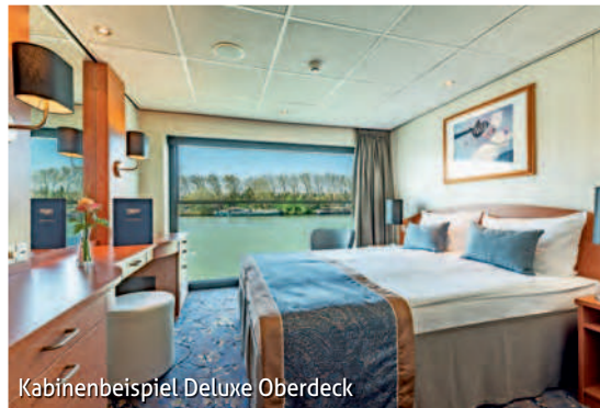
Kabinenbeispiel Deluxe Oberdeck