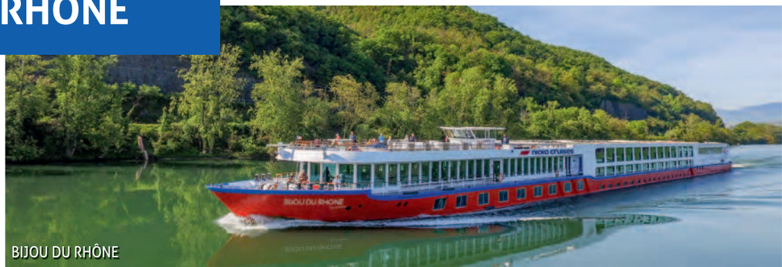
BIJOU DU RHÔNE