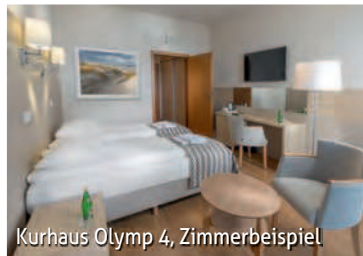
Kurhaus Olymp 4, Zimmerbeispiel