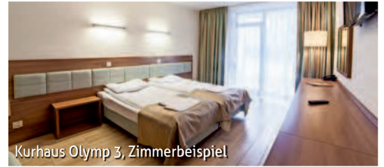
Kurhaus Olymp 3, Zimmerbeispiel