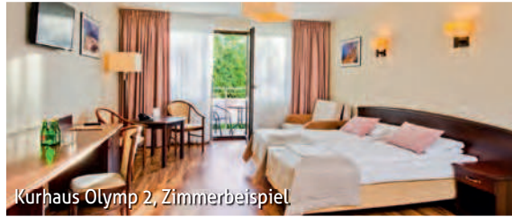
Kurhaus Olymp 2, Zimmerbeispiel