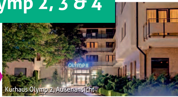
Kurhaus Olymp 2, Außenansicht