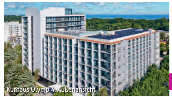
Kurhaus Olymp 4, Außenansicht