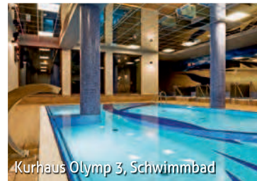
Kurhaus Olymp 3, Schwimmbad