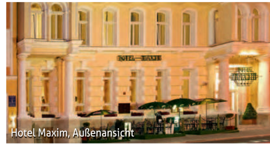
Hotel Maxim, Außenansicht