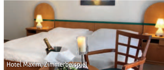
Hotel Maxim, Zimmerbeispiel