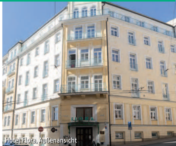
Hotel Flora, Außenansicht