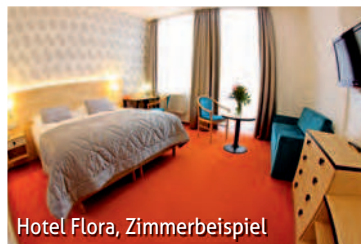
Hotel Flora, Zimmerbeispiel