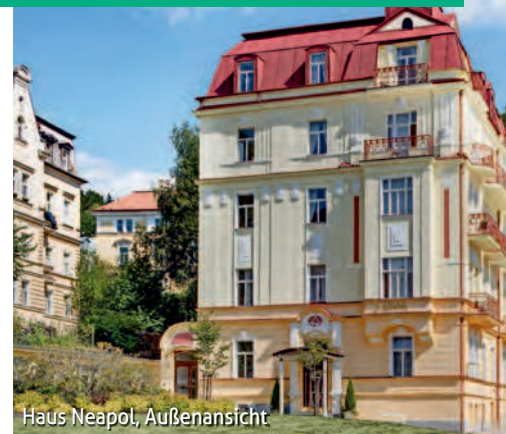
Haus Neapol, Außenansicht