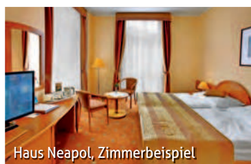
Haus Neapol, Zimmerbeispiel