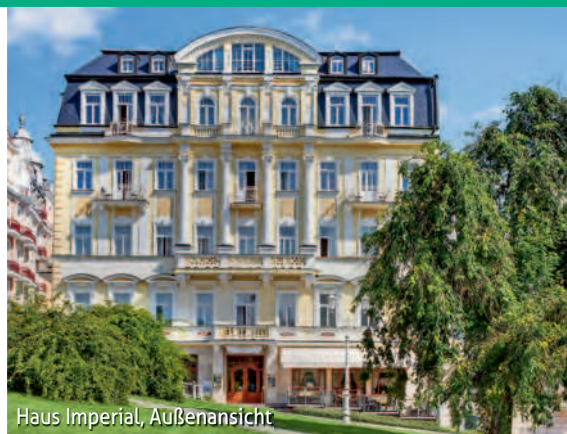
Haus Imperial, Außenansicht