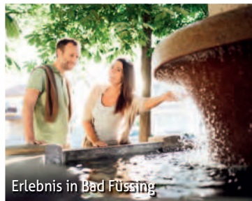
Erlebnis in Bad Füssing