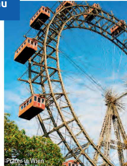
Prater in Wien