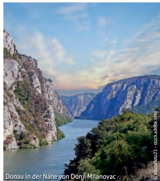
Donau in der Nähe von Donji Milanovac