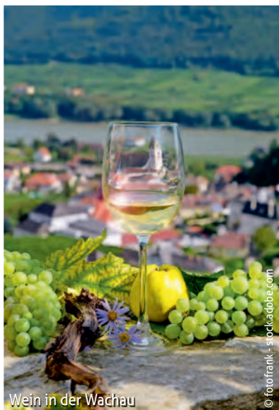
Wein in der Wachau